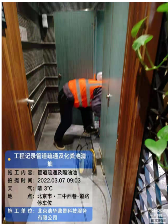
● 工程记录管道疏通及化粪池清抽 施工内容: 管道疏通及隔油池 拍摄时间: 2022.03.07 09:03 天气: 晴 3°C 地点: 北京市·三中西巷-道路停车位 施工单位: 北京浩华鼎盛科技服务有限公司