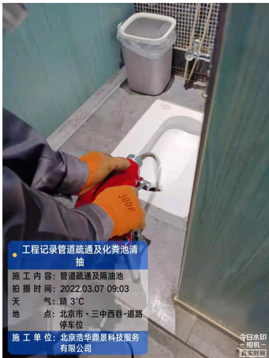
● 工程记录管道疏通及化粪池清抽 施工内容: 管道疏通及隔油池 拍摄时间: 2022.03.07 09:03 天气: 晴 3°C 地点: 北京市·三中西巷-道路停车位 施工单位: 北京浩华鼎盛科技服务有限公司