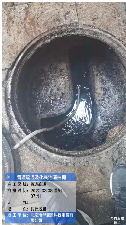
● 管道疏通及化粪池清抽掏 施工区域: 管道疏通 拍摄时间: 2022.03.08 星期二 07:41 天气: 地点: 我在这里 施工单位: 北京浩华鼎盛科技服务有限公司