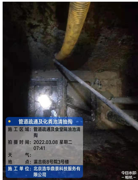
● 管道疏通及化粪池清抽掏 施工区域：管道疏通及食堂隔油池清抽 拍摄时间：2022.03.08 星期二 07:41 天气： 地点：瀛吉街8号院3号楼 施工单位：北京浩华鼎盛科技服务有限公司