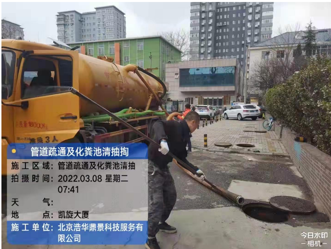
● 管道疏通及化粪池清抽掏 施工区域：管道疏通及化粪池清抽 拍摄时间：2022.03.08 星期二 07:41 天气： 地点：凯旋大厦 施工单位：北京浩华鼎景科技服务有限公司