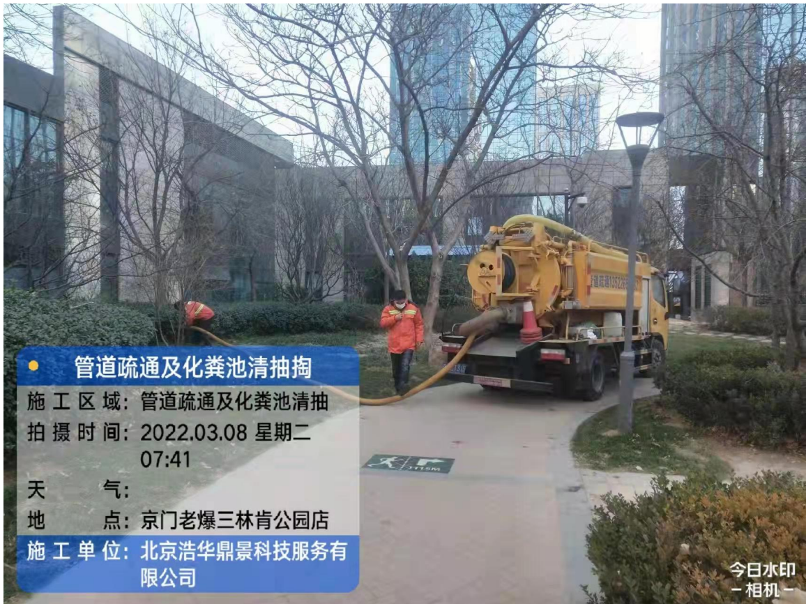
● 管道疏通及化粪池清抽掏 施工区域：管道疏通及化粪池清抽 拍摄时间：2022.03.08 星期二 07:41 天气： 地点：京门老爆三林肯公园店 施工单位：北京浩华鼎景科技服务有限公司