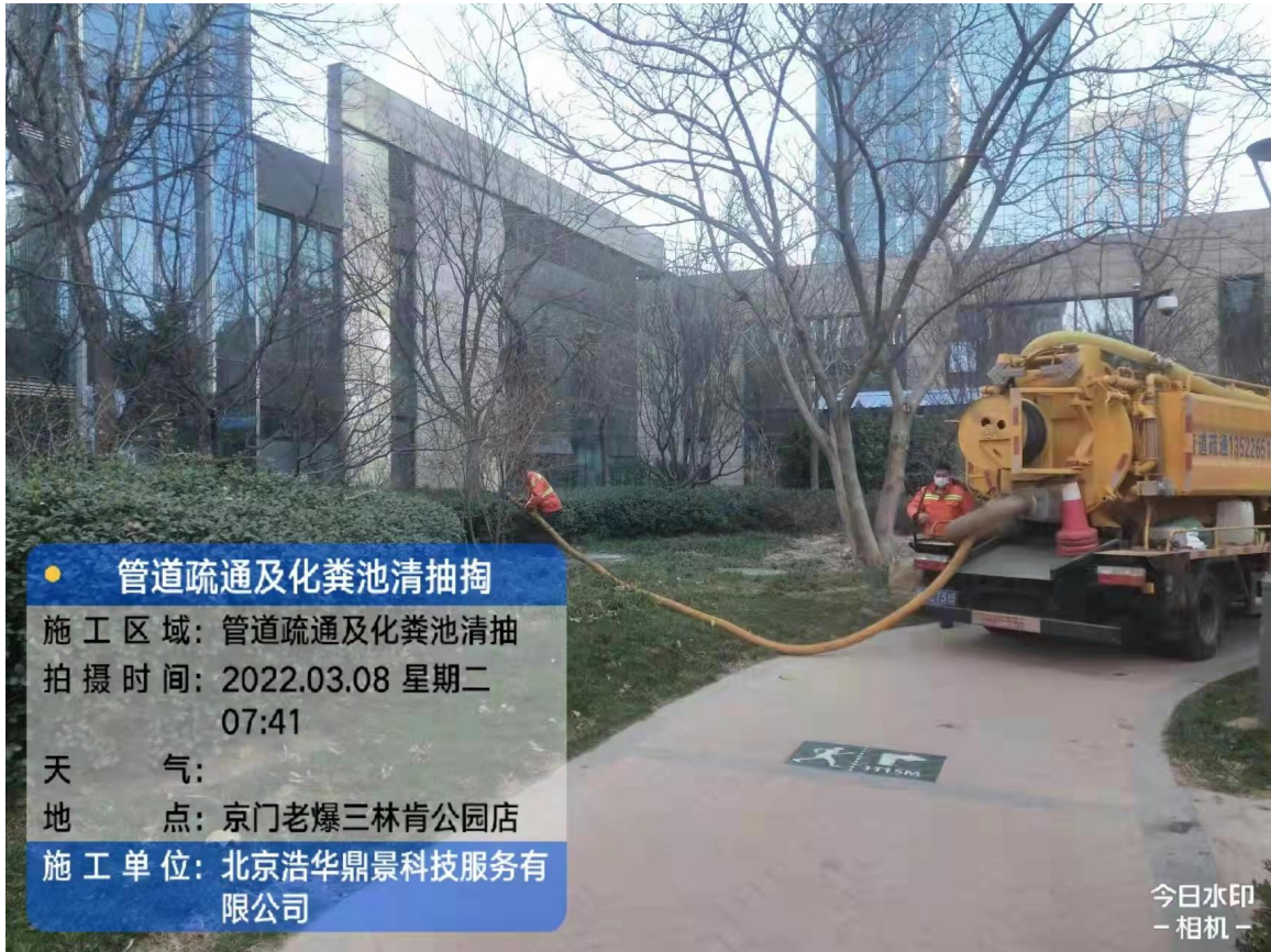
● 管道疏通及化粪池清抽掏 施工区域：管道疏通及化粪池清抽 拍摄时间：2022.03.08 星期二 07:41 天气： 地点：京门老爆三林肯公园店 施工单位：北京浩华鼎景科技服务有限公司