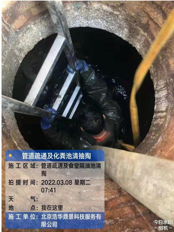
● 管道疏通及化粪池清抽掏 施工区域：管道疏通及食堂隔油池清抽 拍摄时间：2022.03.08 星期二 07:41 天气： 地点：我在这里 施工单位：北京浩华鼎盛科技服务有限公司