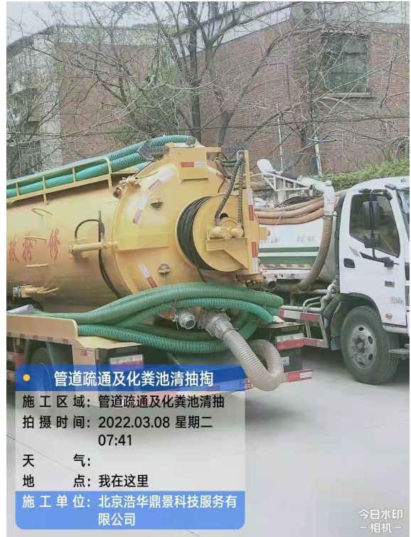
● 管道疏通及化粪池清抽掏 施工区域：管道疏通及化粪池清抽 拍摄时间：2022.03.08 星期二 07:41 天气： 地点：我在这里 施工单位：北京浩华鼎盛科技服务有限公司