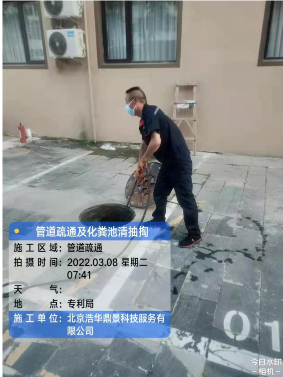
● 管道疏通及化粪池清抽掏 施工区域：管道疏通 拍摄时间：2022.03.08 星期二 07:41 天气： 地点：专利局 施工单位：北京浩华鼎盛科技服务有限公司