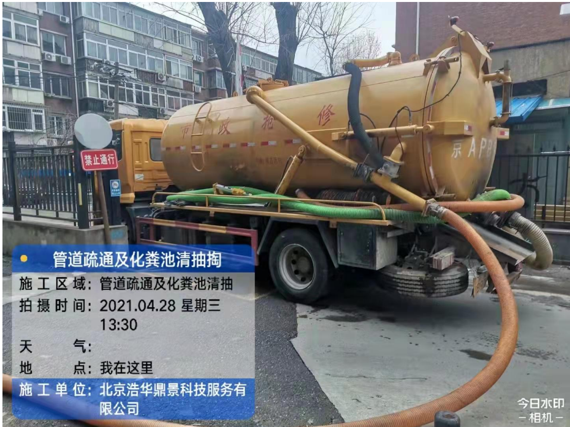
● 管道疏通及化粪池清抽掏 施工区域：管道疏通及化粪池清抽 拍摄时间：2021.04.28 星期三 13:30 天气： 地点：我在这里 施工单位：北京浩华鼎景科技服务有限公司